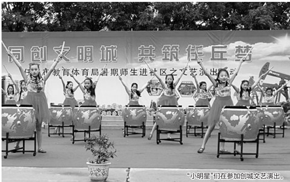
“小明星”们在参加创城文艺演出。

“这张贴在这儿，扶正了……”近日，在任丘市中华瑞鑫小区，公开栏前跃动着一群孩子。他们在张贴“爱护环境，人人有责”手抄报。