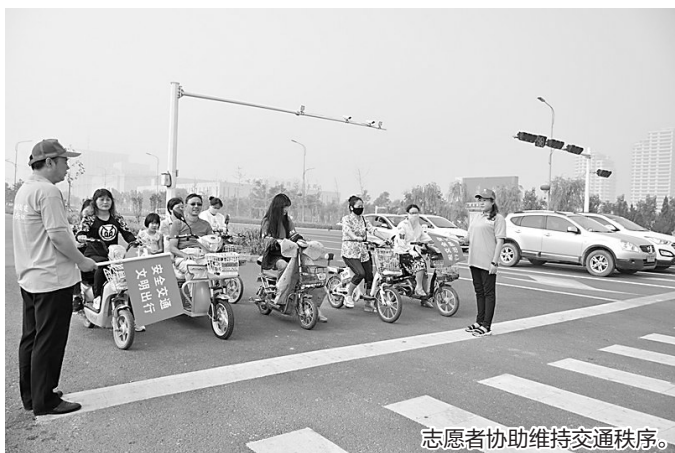
志愿者协助维持交通秩序。

今年以来,任丘市加大交通秩序治理力度,开展了多项交通违法行为整治行动,并且在加大打击力度的同时,不断完善“硬件”设施,深入宣传文明交通,为城市文明增添了一份独特的“秩序美”。