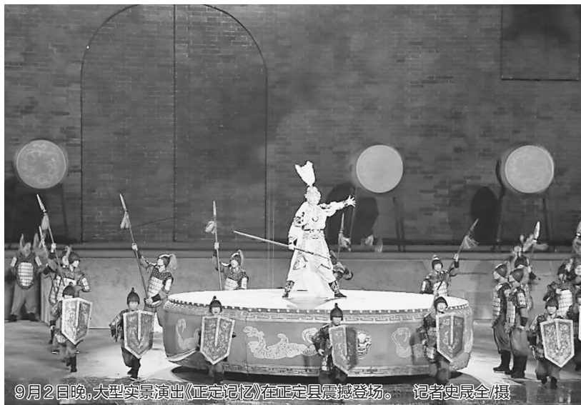
9月2日晚，大型实景演出《正定记忆》在正定县震撼登场。