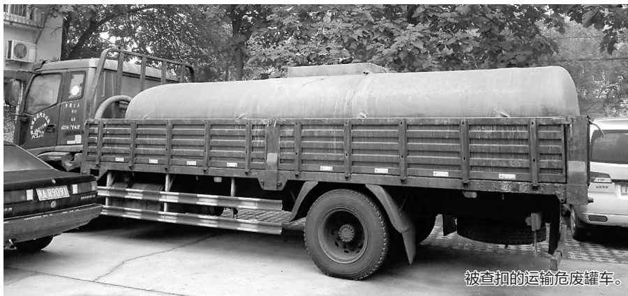
被扣押的运输危废罐车。

本报讯(记者刘岚)8月29日凌晨,省环保厅第一环境监察专员办公室监察人员在无极县突击夜查时,及时查处一辆刚刚上路的运输危险废物的罐车,成功避免了一起违法运输倾倒危废的恶性事件。目前案件已移交公安部门。