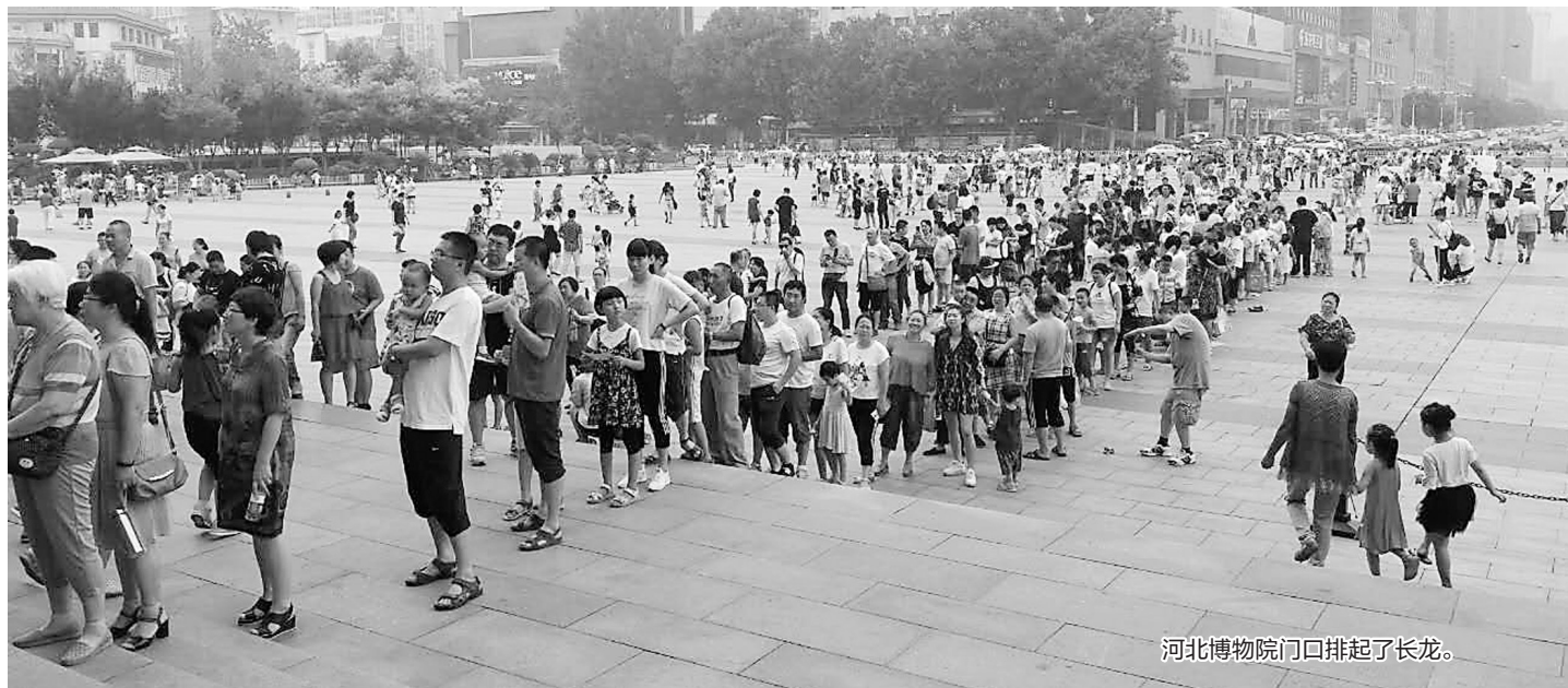
河北博物院门口排起了长龙。

也许,博物馆在很多人心中,是一个“高冷”的存在,安静深邃,和我们的生活有着不小的距离。于我们的孩子而言,它可能更是“陌生”和“高深”的代名词。可如今,博物馆还真的如此不可亲近吗?昨日,记者从河北博物院获悉,今年,石家庄人似乎越来越“青睐”博物院,据不完全统计,截至8月30日,河北博物院参观人数达到746551人次,超过了去年全年的69.6万人次,创下了新高。而刚刚过去的暑假,很多不想让孩子每天憋在家里,不想让孩子每天看电视、刷手机、玩游戏的家长们,都把亲子活动安排到了博物院,七、八月份的参观人数占到了全年总人数的一半左右。