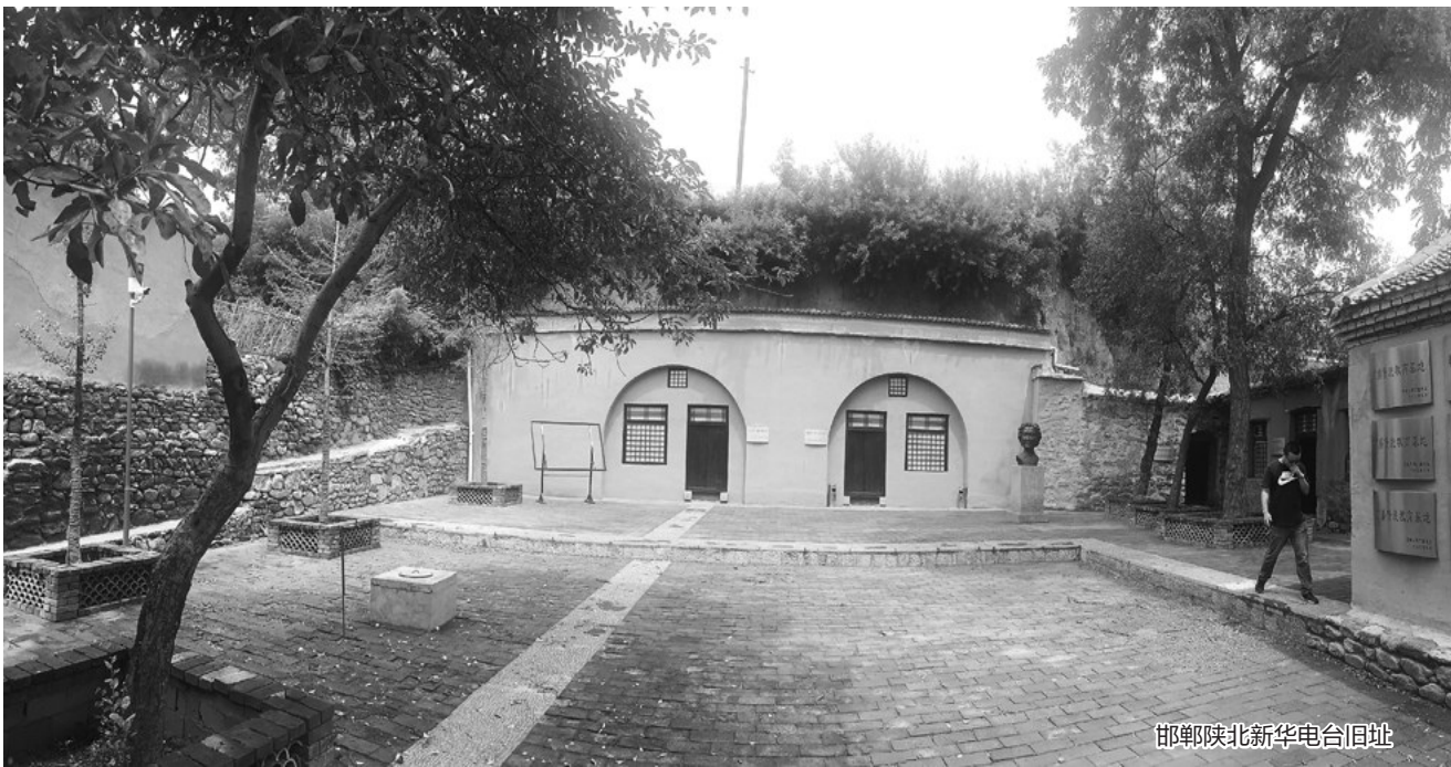
邯郸陕北新华电台旧址