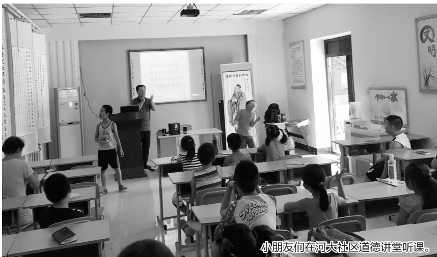
小朋友们在河大社区道德讲堂听课。

一段段孝心少年故事,一本本国学文化读本,一堂90分钟的“道德讲堂”往往每天都要拖堂半小时,孩子们学到感动之处个个热泪盈眶,“这样的课我们愿意一直上下去。”这是近日保定河大社区道德讲堂上发生的一幕。