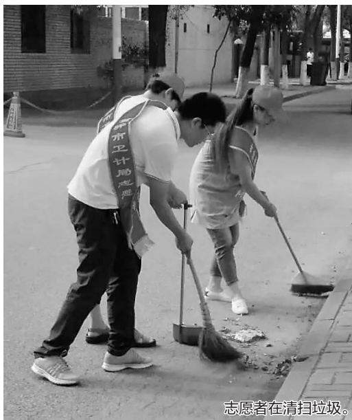
志愿者在清扫垃圾。

时逢酷暑,在黄骅市的大街小巷,市民们经常能看到一队队的“红马甲”“小红帽”们不畏酷暑,认真地做着志愿服务。即使汗流浹背,他们也要把地面上的垃圾捡起来;即使烈日当头,他们也要做好交通引导。这些“红马甲”“小红帽”是来自黄骅市100多个单位的志愿者以及“渤海魂”“红色朝阳”等十余个志愿者团队。在创建全国文明城市的攻坚阶段,黄骅市掀起了人人争做志愿者、人人争创文明城市的热潮。