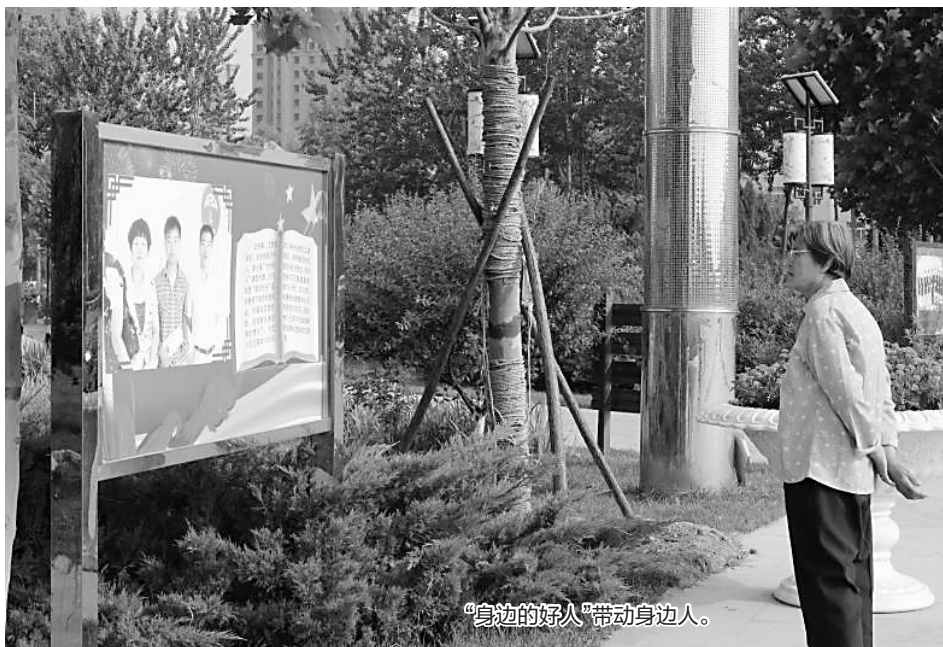
“身边的好人”带动身边人。